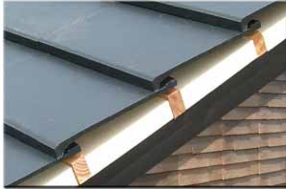
Air-roof insulation system